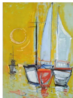
ホレイショフスカ